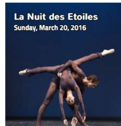
La Nuit des Etoiles Sunday, March 20, 2016