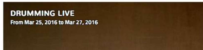
DRUMMING LIVE From Mar 25, 2016 to Mar 27, 2016