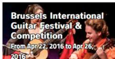
Brussels International Guitar Festival & Competition From Apr 22, 2016 to Apr 26, 2016