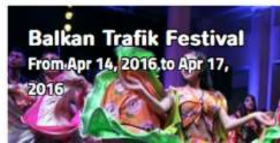
Balkan Trafik Festival From Apr 14, 2016 to Apr 17, 2016