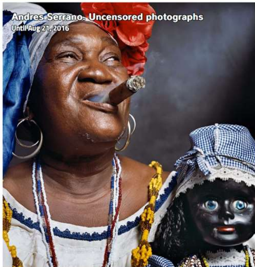
Andres Serrano. Uncensored photographs Until Aug 21, 2016