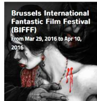
Brussels International Fantastic Film Festival (BIFFF) From Mar 29, 2016 to Apr 10, 2016