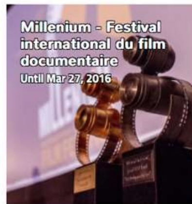
Millenium - Festival international du film documentaire Until Mar 27, 2016