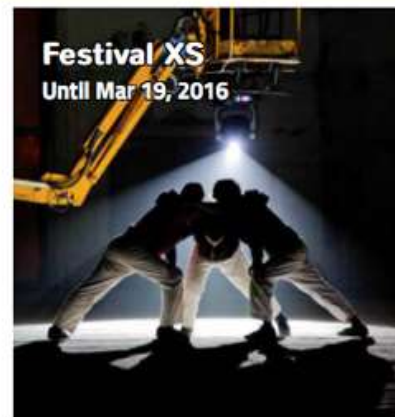
Festival XS Until Mar 19, 2016