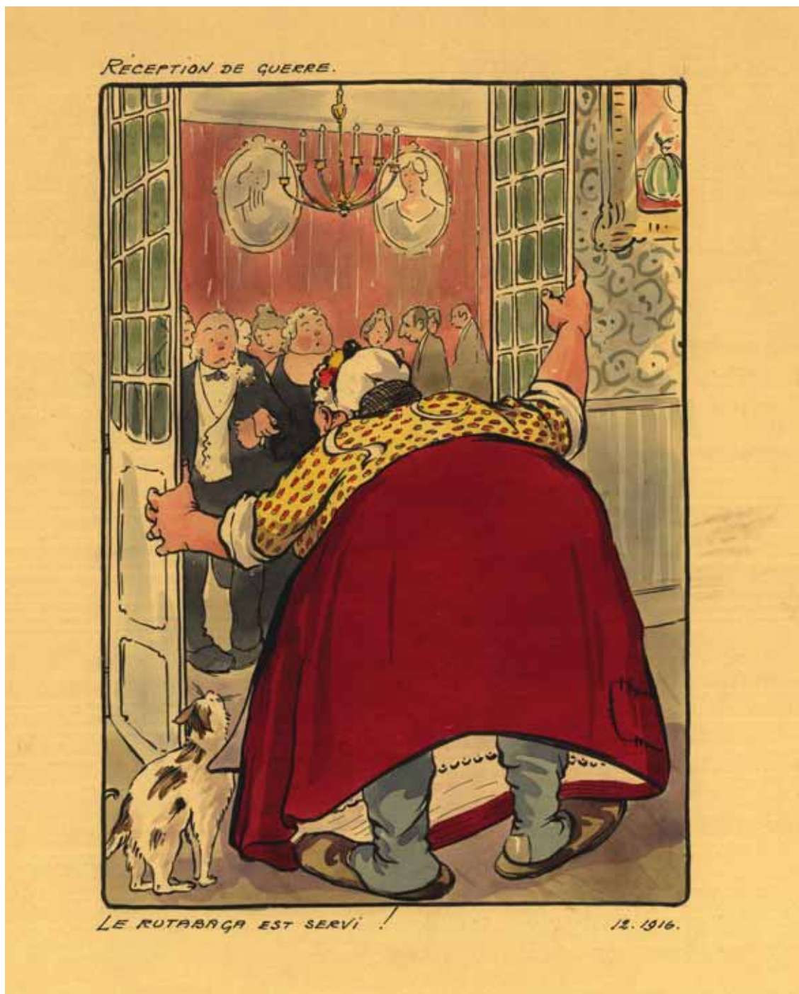
"Oorlogsreceptie." "De koolraap staat op tafel!"

Het Broodhuis zal eveneens meermaals het theatergezelschap "MAPS" binnen zijn muren verwelkomen, dat er zijn veelzijdige spektakel rond de ervaring van ballingschap in '14-'18 zal opvoeren.