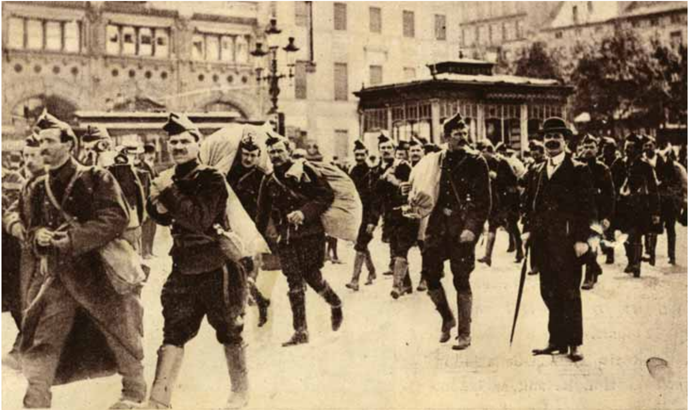
De reservisten op 29 juli