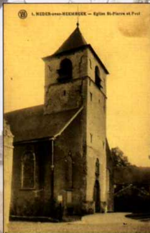
Zicht op de oude Sint-Pieter-en-Pauluskerk (ASB, FCP)

De oudste vermelding van het dorp vinden we in een douarieakte uit 1149. De naam Neder-Over-Heembeek verwijst naar de twee heerlijkheden die vroeger het grondgebied vormden en genoemd naar hun ligging stroomafwaarts - neder -, en stroomopwaarts - over - van de Heembeek, die uitmondt in de Zenne. De twee middeleeuwse kernen van de gemeente worden in 1814 verenigd en vormen vanaf dan één entiteit. Hoewel de structuur van de Stad nu een geheel vertoont, zijn er toch nog overblijfselen van die dubbele oorsprong zoals de twee oude kerken die er nog staan: de Sint-Niklaaskerk in Over-Heembeek en de Romaanse toren van de oude Sint-Pieter-en- Pauluskerk.