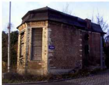
Paviljoenen bij de ingang van het vroegere Meudonlandgoed