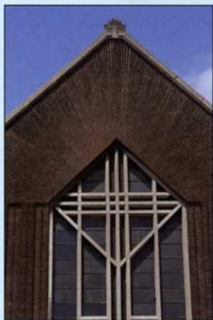
Detail van het fronton van de Sint-Pieter-en-Pauluskerk