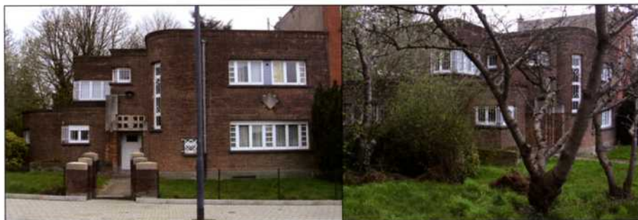
Modernistische pastorie van de Sint-Pieter-en- Paulusparochie

Niet ver van de Sint-Pieter- en-Pauluskerk laat de Stad Brussel in 1935 een pastorie bouwen, een project dat wordt toevertrouwd aan architect François Malfait. Dit bouwwerk in modernistische stijl en vervaardigd uit rode baksteen bestaat uit een subtiële samenstelling van verschillende volumes van opeenvolgende inspringende gedeelten. De harmonieuze overgang tussen de verschillende vlakke gedeelten van de gevel wordt bekomen door bepaalde constructiedetails die getuigen van grote nauwkeurigheid bij de conceptie van het gebouw. De afgeronde hoeken van de volumes of het plaatsen van grote ramen op de scherpe kanten van de volumes nemen die functie op zich. Vooral de hoekvensters creëren een perspectief op het volgende vlak, te meer omdat de pijler op de hoek van de twee muurvlakken met lichtkleurige tegels is bekleed waardoor dit minder opvallend is. De toegangsdeur komt goed tot haar recht dankzij een monumentale pijler bekleed met blauwe stenen. Het raam boven de deur is versierd met een kruis en benadrukt op ondubbelzinnige wijze de functie van de plaats.