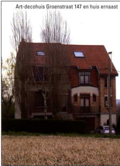
Art-decohuis Groenstraat 147 en huis ernaast

In dit grote onderzoekscentrum, gebouwd tussen 1959 en 1965, zijn de laboratoria van de Groep Solvay ondergebracht. De zuivere, eenvoudige lijnen van het gebouw ontworpen door architect Henri Montois (1920- ) verwijzen naar onderzoek en administratie, de twee functies waarvoor het gebouw gebruikt wordt. Beide functies worden uitgeoefend in een van de twee T-vormige vleugels van het gebouw. De toegankelijkheid van het structuurontwerp en de organisatie wordt nog benadrukt door de ligging van het gebouw op de helling van een ontruimd terrein waardoor het volledig tot zijn recht komt. Het restaurant, van de hand van E. Cosac, bevat muurkeramieken van het Atelier de Dour (Roger Somville, M-H Bataille, C. Lambert) met als thema Vrije tijd .