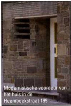
Modernistische voordeur van het huis in de Heembeekstraat 199

In 1966 stelt beeldhouwer Albin Courtois (1928- ) in het Cultureel Centrum van Brussel de maquette voor van een werk getiteld Hembecca . Deze veelvuldig onderscheiden kunstenaar – o.a. met de beroemde Prijs van Rome (1962) – raakte bekend door de verwezenlijking van totemistische beeldhouwwerken. Hij maakt ook intiemere werken waaronder La Tendresse maternelle (De moederlijke Tederheid) opgesteld op het balkon van een huis van de architect Josse Franssen (verderop vermeld). De beslissing van de gemeenteraad om het werk aan te kopen werd echter maar op 1 oktober 1973 bij stemming goedgekeurd. De inhuldiging vindt plaats op 24 mei 1975 ter gelegenheid van het 800-jarig bestaan van Neder-Over-Heembeek. Hembecca is zo een symbool geworden dat verwijst naar de historische oorsprong van de gemeente, een getuige van de eensgezindheid met de twee aangrenzende gemeenten, Haren en Laken, maar eveneens een teken om te integreren in de grote verkeersaders waarlangs je Neder-Over-Heembeek binnenrijdt. Na vele discussies werd het beeldhouwwerk uiteindelijk in een rustig parkje langs de Oorlogskruisenlaan ondergebracht.