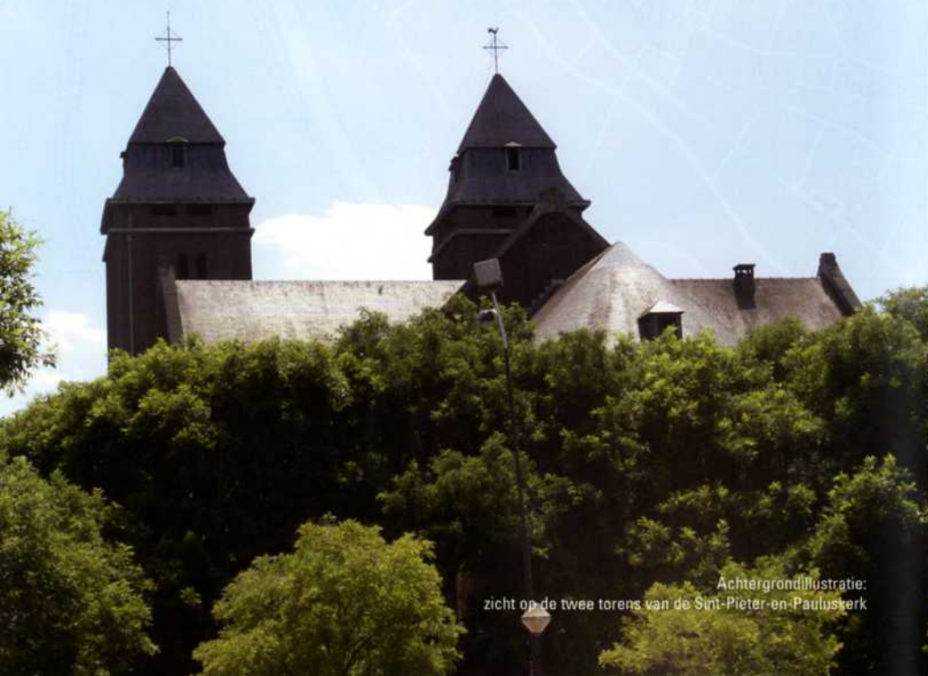
Achtergrondillustratie: zicht op de twee torens van de Sint-Pieter-en-Pauluskerk