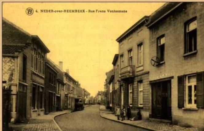
De François Vekemansstraat in de 19e eeuw (ASB, FCP)

In de loop van de 19e en 20e eeuw is de agglomeratie aanzienlijk veranderd: velden, boomgaarden en weilanden zijn geleidelijk verdwenen, de grote buitenverblijven aan de rand van het kanaal hebben plaats gemaakt voor belangrijke industriezones onder druk van een toenemende urbanisering en de ontwikkeling van secundaire en tertiaire activiteiten. De industriële activiteit heeft zich na de inlijving langs het kanaal geconcentreerd (met de verbreding van het kanaal ter hoogte van de Van Praetbrug onder Leopold II om zo de voorhaven van Brussel te vormen), terwijl landbouw en woonhuizen de hellingen hebben ingepalmd. De vestiging in de gemeente van talrijke familiale exploitaties van snijbloemen en de woonactiviteit verbonden aan de industrialisatie verklaren de aanwezigheid van verschillende bescheiden constructies en serres die tot het einde van de Tweede Wereldoorlog een belangrijk deel van de woonvorm kenmerken. Neder-Over-Heembeek heeft niettemin een opmerkelijke historische kern bewaard en bezit een hedendaags privé- en industrieel erfgoed dat de moeite waard is.