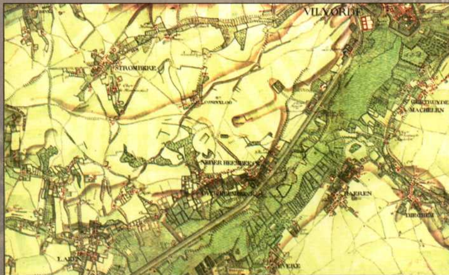
Kaart van de Oostenrijkse Nederlanden gemaakt op initiatief van de graaf van Ferraris, 1776