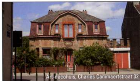
Art-decohuis, Charles Cammaertstraat 32

Op 1 augustus 2007 werd door de Stad Brussel een aanvraag tot klassering van het goed ingediend.