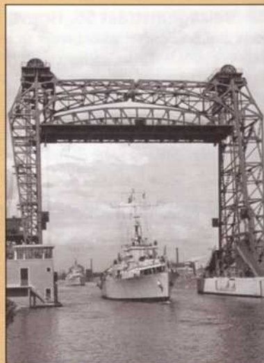
Zicht op de Budabrug (ASB, Fl. C 2725)

In de loop van de 19e en 20e eeuw is de agglomeratie aanzienlijk veranderd: velden, boomgaarden en weilanden zijn geleidelijk verdwenen, de grote buitenverblijven aan de rand van het kanaal hebben plaats gemaakt voor belangrijke industriezones onder druk van een toenemende urbanisering en de ontwikkeling van secundaire en tertiaire activiteiten. De industriële activiteit heeft zich na de inlijving langs het kanaal geconcentreerd (met de verbreding van het kanaal ter hoogte van de Van Praetbrug onder Leopold II om zo de voorhaven van Brussel te vormen), terwijl landbouw en woonhuizen de hellingen hebben ingepalmd. De vestiging in de gemeente van talrijke familiale exploitaties van snijbloemen en de woonactiviteit verbonden aan de industrialisatie verklaren de aanwezigheid van verschillende bescheiden constructies en serres die tot het einde van de Tweede Wereldoorlog een belangrijk deel van de woonvorm kenmerken. Neder-Over-Heembeek heeft niettemin een opmerkelijke historische kern bewaard en bezit een hedendaags privé- en industrieel erfgoed dat de moeite waard is.